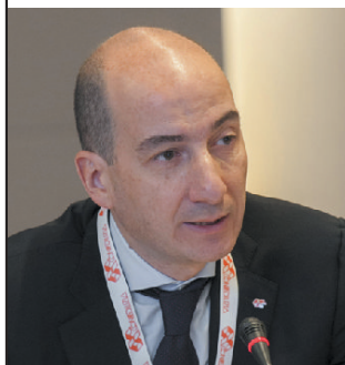
Il presidente Giorgio Spaziani Testa

Si coglie l'occasione per segnalare che le associazioni territoriali della Confedilizia (info su www.confedilizia.it ) sono a disposizione per ogni assistenza, compreso il servizio di visure catastali».